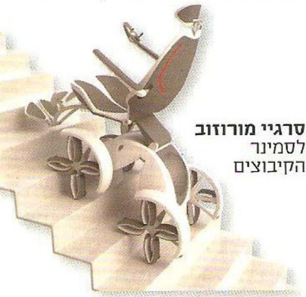
סרגיי מורוזוב לסמינר הקיבוצים

★ סמינר הקיבוצים: קמפוס אמנויות, ש פרסיץ 3, ת"א. תאריכים: 16.7-26.7. שעות פתיחה: א'-ה' 12:00-20:00, ו' 10:00-00:00