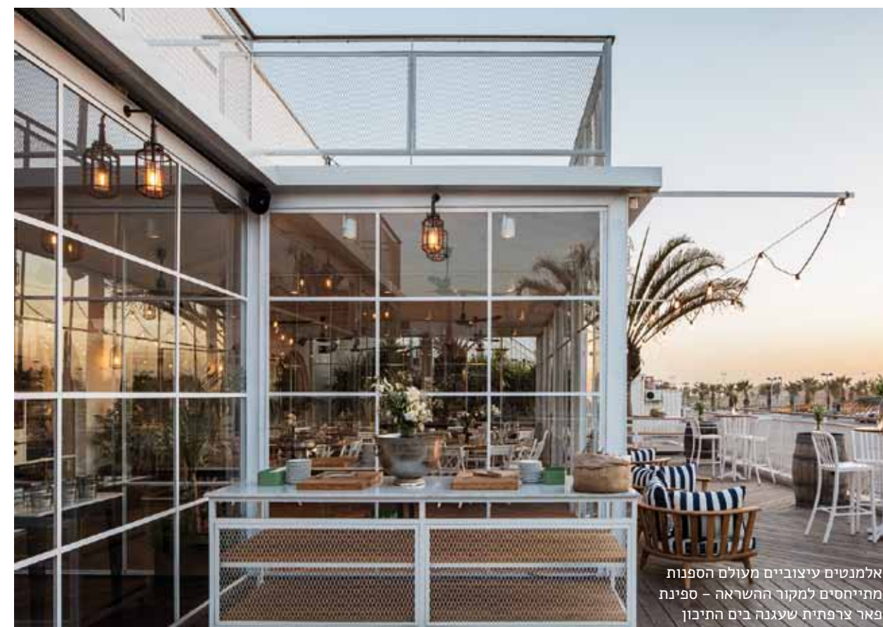
אלמנטים עיצוביים מעולם הספנות מתייחסים למקור ההשראה - ספינת פאר צרפתית שעגנה בים התיכון

מבנה ששימש בעבר כחלל אירועים ועמד נטוש על הטיילת באשדוד שופץ ועוצב בהשראת עולם הספנות, ומיועד לאירועי בוטיק על קו החוף | שרון בן דוד