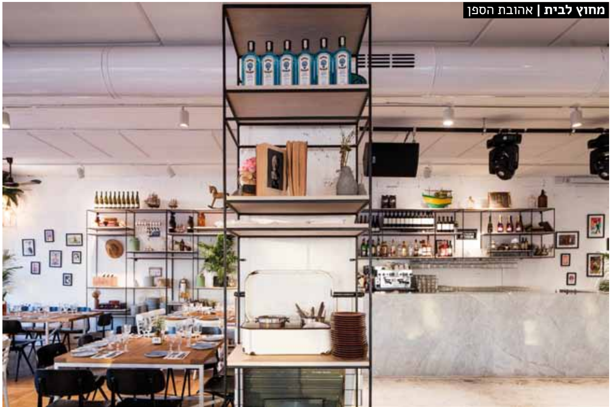
בר ובמטבח בולט הסגנון התעשייתי המתבטא בברזל חשוף ושיש מלוטש